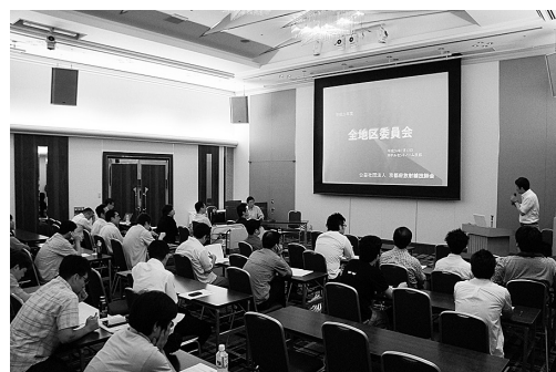
(文責：組織調査委員会 蒲)

全地区委員会は、地区委員と執行部が直接意見を交わす貴重な会合です。各会員は地区に所属しており、直接話しができ執行部とのパイプ役をしてくれるのが地区委員です。些細な意見や要望でもあれば地区委員や地区理事または事務所にメールでも結構ですので執行部に知らせていただくことで技師会活動の活性化につながります。